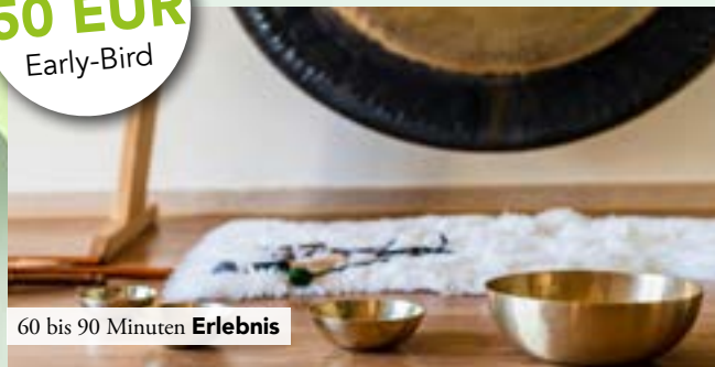
60 bis 90 Minuten Erlebnis