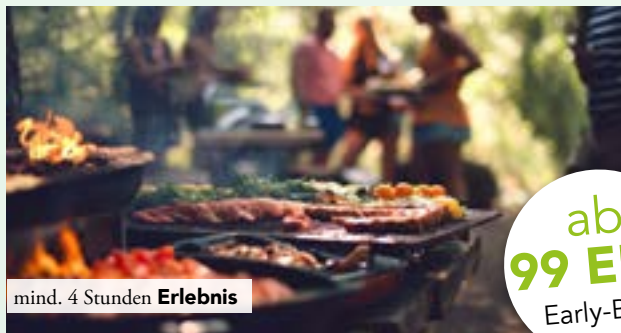
mind. 4 Stunden Erlebnis

Lerne , wie du ohne Stress am offenen Feuer ein Menü zubereitest – begleitet vom Klang unserer Gongs. Riech das Holz, hör das Knistern, spür die echten Aromen. Das ist unser BBQiu : Genuss mit Klang, Feuer & Seele.